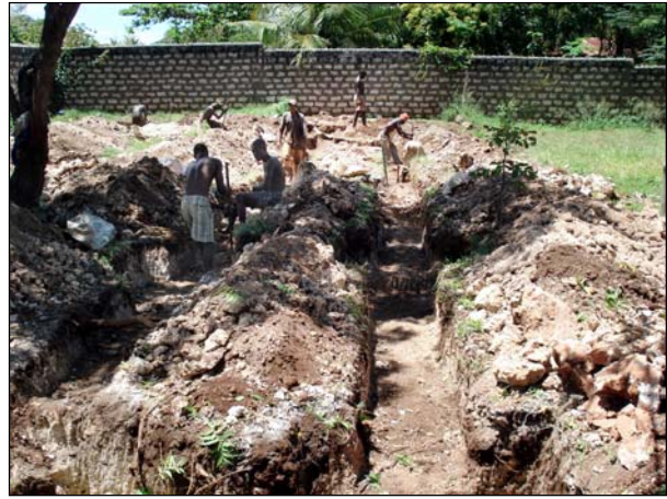
Die ersten Arbeiten für das neue KiD-Schulgebäude.

Hauseinstürze in der Hauptstadt Nairobi zurück zu führen, wo man es wahrscheinlich mit Auflagen und Material nicht so genau genommen hatte.