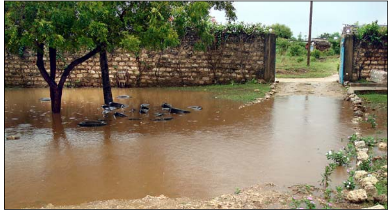
Die Essens-Pausen mußten die Kinder unter dem Vordach der Unterrichtsräume verbringen. Es hat wie aus Eimern geregnet.

Was das Essen anging, gestaltete es sich dieses Mal etwas schwierig. Nein, keine Angst, der Essplatz ist noch völlig ok und es liegen auch keine neuen Bauverordnungen dafür vor. Aber es goss an manchen Tagen einfach so heftig, dass die Lehrer es nicht verantworten wollten, besonders die ganz Kleinen mit den Tellern dorthin laufen zu lassen. Der Regen rauschte über die Wege und sie hatten Sorge, dass etwas passiert. So aßen die Kinder zwar im Freien, aber unter dem Vordach der Unterrichtsräume. Die Stühle waren in Reih und Glied an der Wand aufgereiht und die Lehrer standen in Mäntel gehüllt davor, vorne trocken - hinten nass, und hielten „Wache“. Liebevoller, verantwortungsbewusster „Körper“-Einsatz unserer Mitarbeiter vor Ort. Dieses Bild war wirklich sehenswert!